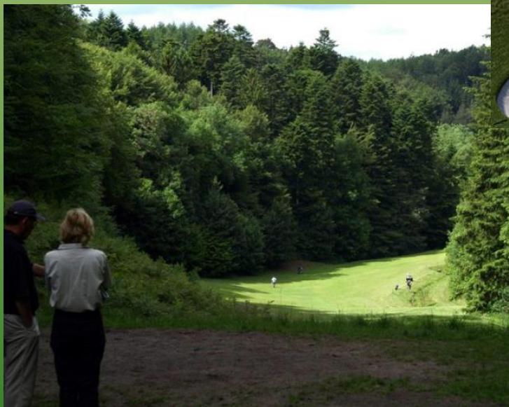
Ordne træer – skære nedhængende grene væk – fx på tee sted hul 5.