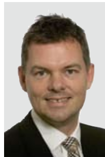
Per Stecher Bane-/Husudvalg